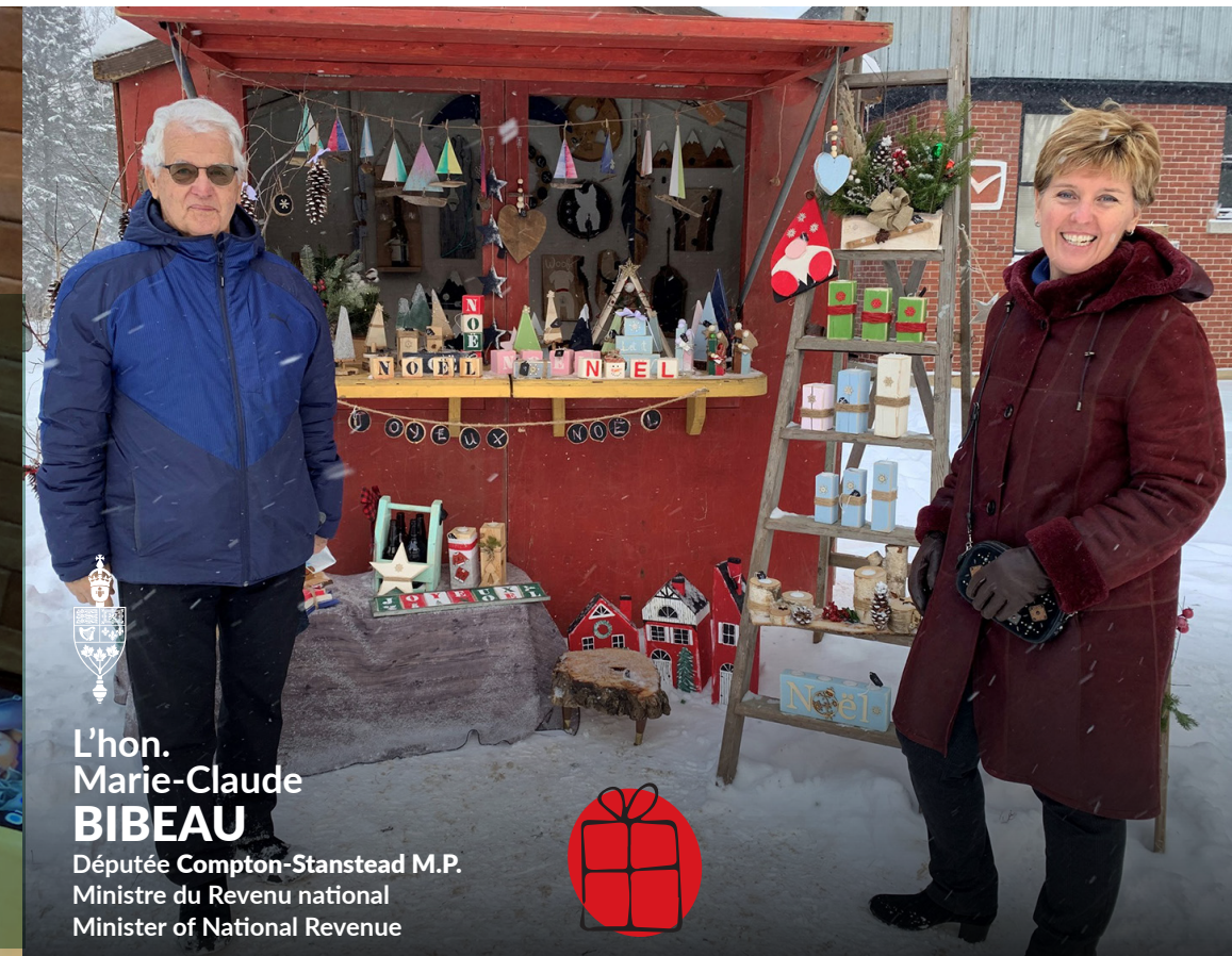
L'hon. Marie-Claude BIBEAU Députée Compton-Stanstead M.P. Ministre du Revenu national Minister of National Revenue

According to the information at the time of printing. For details and other events visit mcbibeau.ca